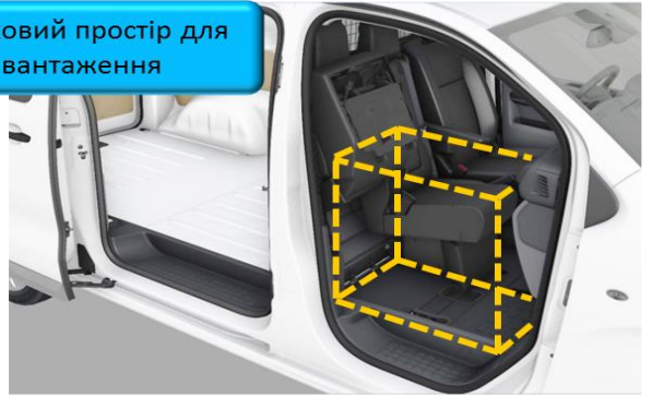
Додатковий простір для завантаження