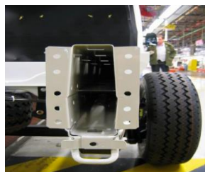
Подвійна рамна рейка "U"-типу.

1. Ціни на автомобілі та додаткові опції вказані в гривнях, у тому числі ПДВ. Спеціальні ціни діють з 12.06.2018 по 30.06.2018 на обмежену кількість автомобілів 2017 року виробництва, що знаходяться в період дії спеціальної акції в Україні.